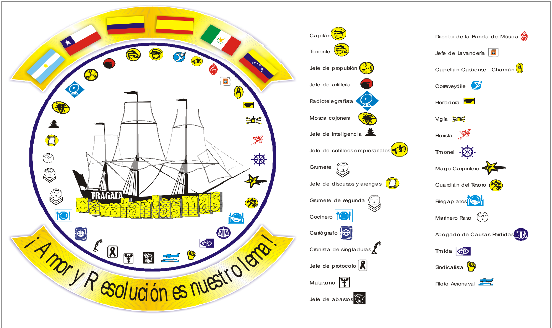
GRÁFICO DE ROLES DE LA FRAGATA CAZAFANTASMAS (Da. LUISA AMELIA JARAMILLO)